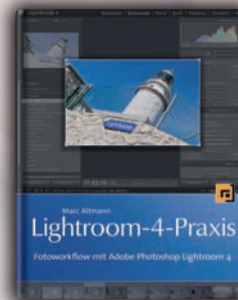
2012, 448 Seiten · € 39,90 (D) ISBN 978-3-89864-832-5