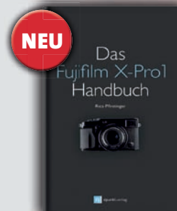
2012, 276 Seiten · € 29,90 (D) ISBN 978-3-86490-004-4