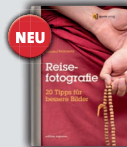
2012, 134 Seiten · € 16,95 (D) ISBN 978-3-86490-028-0