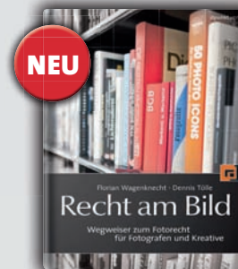
2012, 316 Seiten · € 34,90 (D) ISBN 978-3-86490-010-5